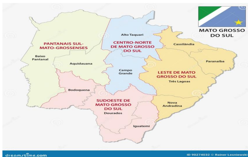
Imagem do Amapá:- 01. Do município de Aquidauana, segundo dados do O Instituto Brasileiro de Geografia e Estatística - (IBGE, 2022).